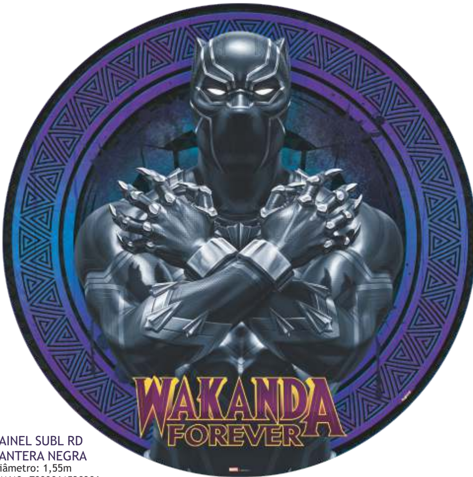
PAINEL SUBL RD PANTERA NEGRA Diâmetro: 1,55m EAN13: 7899061528386 REF.: 336016